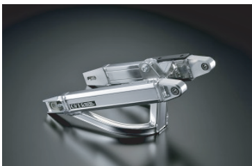
・モンキー OVタイプ スタビ付 (モノショック用)