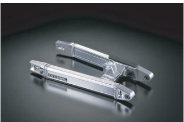
・モンキー OVタイプ スタビ付 (モノショック用)