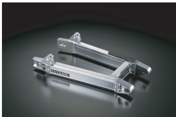
・モンキー OVタイプ