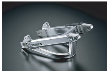
・モンキー OVタイプ スタビ付