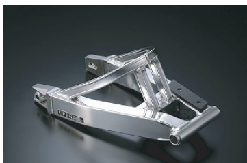
・APE リブ付パイプ スタビ付