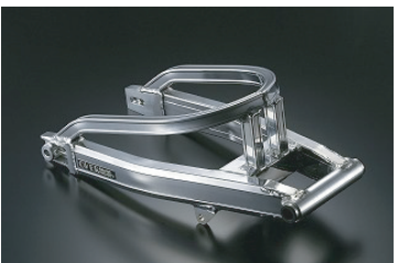
・APE OVタイプ スタビ付